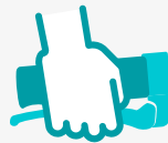
Sistema de freno accionado por cuidador