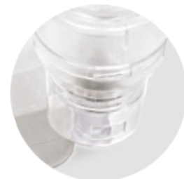
Práctico soporte para el nebulizador