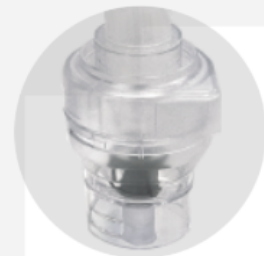
Nebulizador innovador: tratamiento eficaz para las vías respiratorias bajas