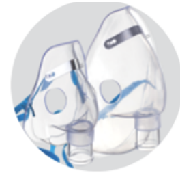
Dos mascarillas: comodidad para niños y adultos