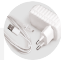
Alimentación a través de un puerto micro-USB: práctico y siempre a mano.